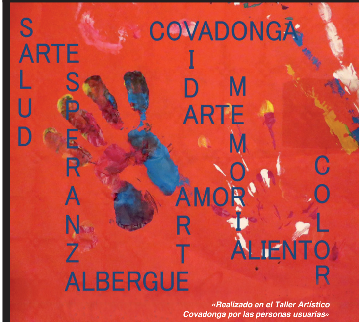
«Realizado en el Taller Artístico Covadonga por las personas usuarias»

Todas las colaboraciones son de vital importancia en un proyecto como el nuestro: tú también puedes colaborar, idona ahora!