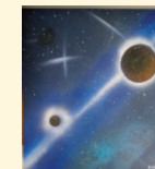
Taller Pintura del Albergue Covadonga