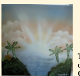
Taller Pintura del Albergue Covadonga

140 acciones para la formación e incorporación laboral